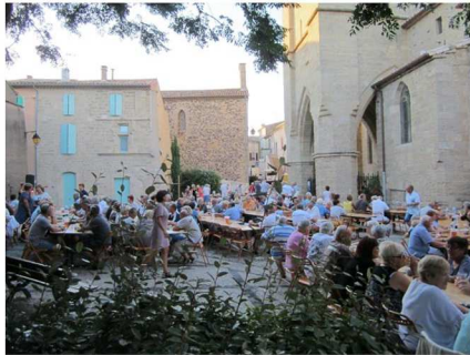
Repas musical animé par JP MUSIC Spectacle de la Cie OZÉCLATS