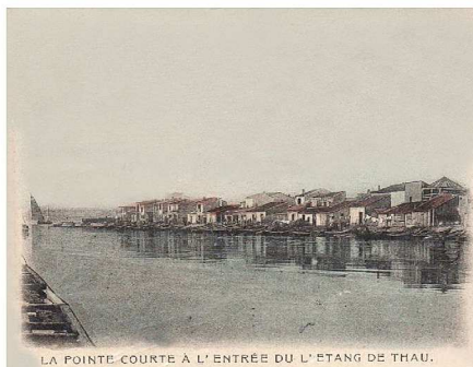
LA POINTE-COURTE À L'ENTRÉE DU L'ÉTANG DE THAU.