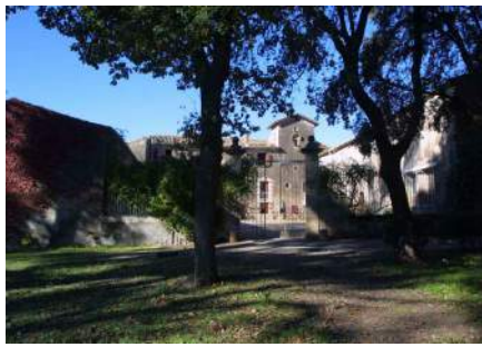
Domaine de Belles-Eaux