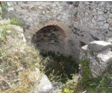
Four à chaux de Maro